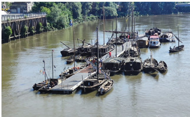
Rassemblement de bateaux Ligériens lors de Débord de Loire.

Après une belle participation aux fêtes de l'Erdre avec le Chabot, du 30 août au 3 septembre, les Bateliers du Cher étaient présents sur la Loire pour la Grande remontée du 2 septembre au 16 septembre pour rallier Orléans avec le Léonardo. Les Bateliers étaient également présents sur le bassin d'Orléans, avec le Gaillard et le Léonardo pour le Festival de Loire du 20 au 24 septembre.