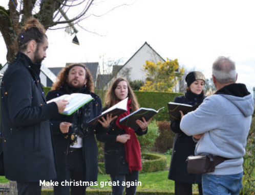
Make christmas great again