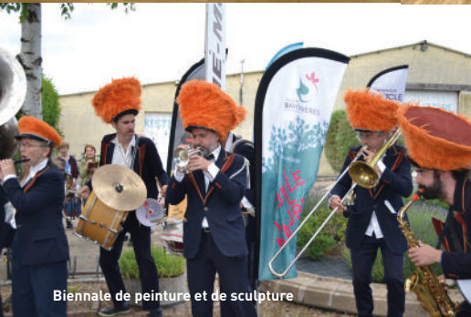
Biennale de peinture et de sculpture