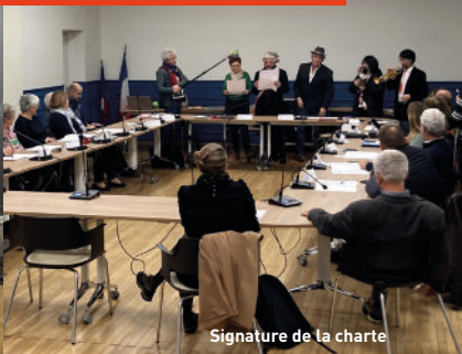
Signature de la charte