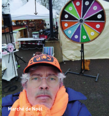
Marché de Noël