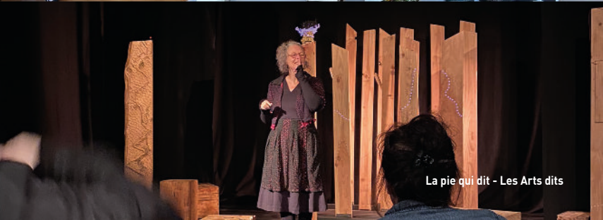
La pie qui dit - Les Arts dits