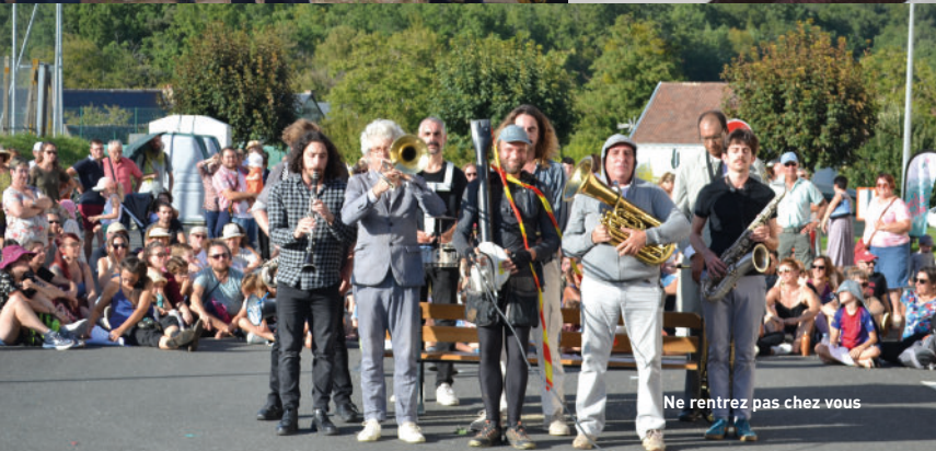
Ne rentrez pas chez vous