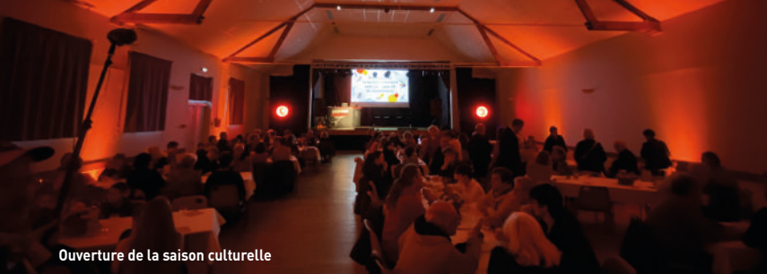
Ouverture de la saison culturelle