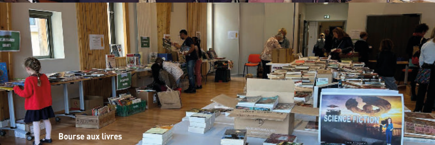
Bourse aux livres