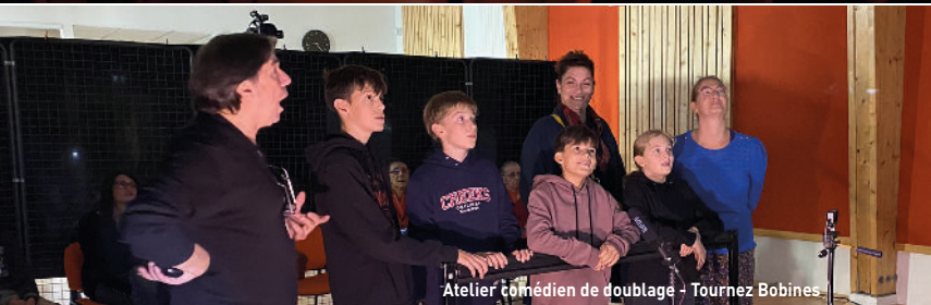
Atelier comédien de doublage - Tournez Bobines