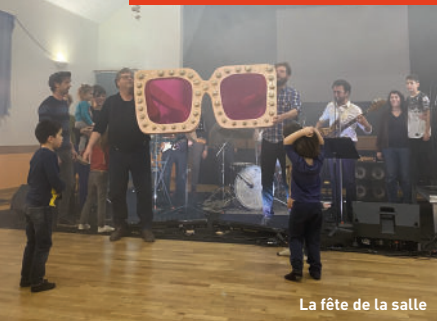
La fête de la salle